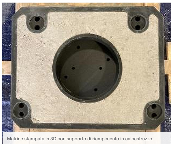
Matrice stampata in 3D con supporto di riempimento in calcestruzzo.

L'utensile è stato utilizzato per formare acciaio alto-resistenziale 590 a doppia fase di 1,6 mm di spessore. Gli ingegneri di 99P Labs hanno analizzato le sollecitazioni e le deformazioni per convalidare la capacità dell'utensile stampato in 3D di soddisfare i carichi di formatura e lo hanno ritenuto accettabile con il riempimento in cemento. Alla fine, lo strumento di formatura in Nylon-12CF FDM ha dato risultati positivi, producendo 40 pezzi e centrando facilmente l'obiettivo di produzione desiderato. La soluzione stampata in 3D ha anche permesso di ottenere una riduzione dei costi del 65% rispetto all'opzione tradizionale di formatura con uno stampo in metallo.