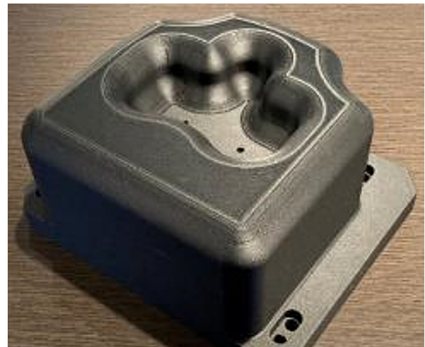
Punzone Nylon 12CF FDM.