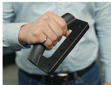
O cabo impresso em 3D em material Dura56.